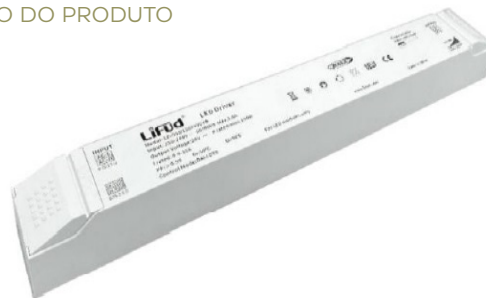
FOTO DO PRODUTO