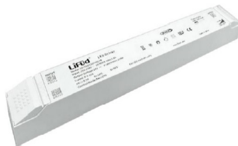
FOTO DO PRODUTO