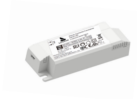
FOTO DO PRODUTO