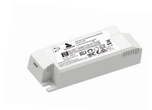
FOTO DO PRODUTO