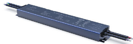
FOTO DO PRODUTO